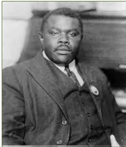
Marcus Mosiah Garvey

Die Ideen seiner Organisation fielen auf fruchtbaren Boden. Sie breitete ihren Einfluss auf der ganzen Welt aus. Garvey selbst reiste durch eine Reihe von mittelamerikanischen Staaten und ließ sich anschließend in den Vereinigten Staaten nieder. Die UNIA-Organisation gewann bald danach an Schlagkraft. Garveys Forderungen waren: Selbstbestimmung für alle Schwarzen, „in der Heimat und im Ausland“. Er gründete eine Bewegung „back to Africa“ und zog sich mit dem Ruf nach einem neuen schwarzen Selbstbewusstsein die Feindschaft der Weißen zu. Großen Einfluss übte er auf junge afrikanische Politiker aus - so zum Beispiel auf „Zik“ Azikiwe aus Nigeria, Kwame Nkrumah aus Ghana und Jomo Kenyatta aus Kenia, die später ihre Länder in die Unabhängigkeit führen sollten. In den Vereinigten Staaten kam es unter Garveys Einfluss zu der berühmten Busfahrt von Montgomery, die die Bürgerrechtsbewegung auslöste. Martin Luther King war später ihr berühmtester Vertreter.